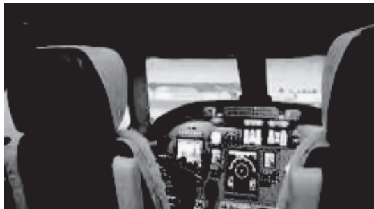
HARDWARE IN THE LOOP